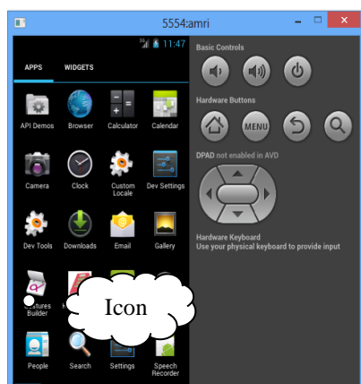
Gbr 2. Tampilan Icon

Tampilan ini akan menampilkan aplikasi kamus latin di dalam menu android secara offline dan tampilan icon aplikasi kamus latin berbasis android sebagai berikut: