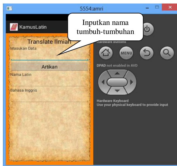
Gbr 4. Tampilan Input

Pada gambar 4 di atas adalah penginputan nama tumbuh-tumbuhan pada aplikasi kamus latin berbasis android dimana penginputan nama tumbuh-tumbuhan ini bertujuan agar