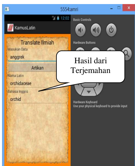
Gbr 6. Tampilan Hasil

Pada tampilan 6 merupakan tampilan hasil. Disini user dapat melihat tampilan terjemahan yang diperoleh. Jika nama tumbuh-tumbuhan yang di inputkan benar user akan melihat