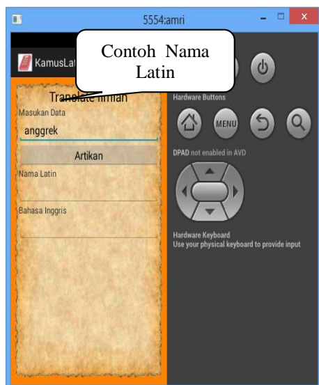
Gbr 5. Tampilan Proses

Pada gambar 5 Dimana user akan menginputkan nama tumbuh-tumbuhan pada aplikasi kamus latin berbasis android . kamus latin tumbuh-tumbuhan tersebut terdiri dari nama latin dan bahasa inggris dimana nama latin dan bahasa inggris tersebut yang berisi tentang terjemahan nama latin tumbuh-tumbuhan dan bahasa inggris. Contoh nama tumbuh-tumbuhan.