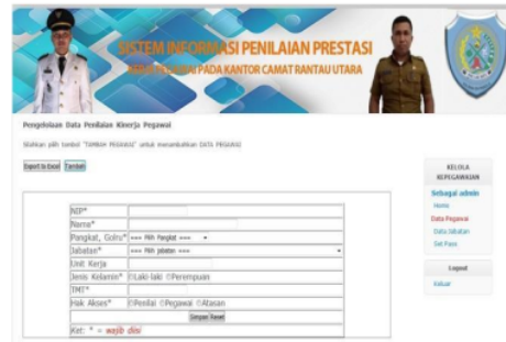
Gambar 2 Tampilan input Data Pegawai Halaman Admin

data Pegawai, langkah – langkah untuk memasukkan data Pegawai antara lain adalah, admin harus mengisi tabel input terlebih dahulu. Tabel input pegawai dapat di lihat pada gambar 4.11 berikut.